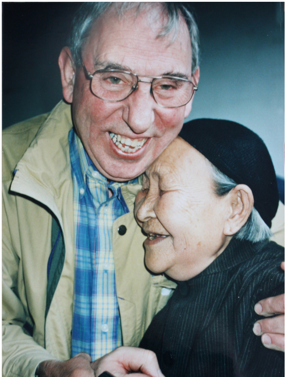
Tore träffade sina småsyskons Dadda vid återvändarresan -95

Text: Annica Alexanderson