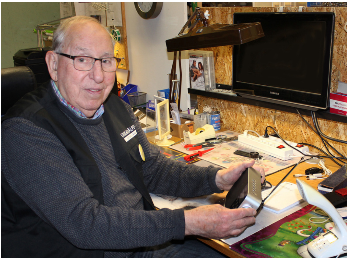
På Erikshjälpen i "Gubbhörnan"